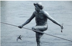
Przechodzący przez Rzekę Mostowa