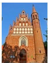
Kościół pobernardyński pw. Najświętszej Maryi Panny Królowej Pokoju