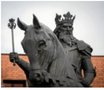
Kazimierz Wielki plac u zbiegu ulic: Trybunalskiej i Wały Jagiellońskie