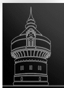
Wieża ciśni w Bydgoszczy