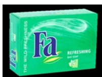
Unilever Polska – zakład Bydgoszcz – fabryka w Bydgoszczy założona w 1932 roku, dawne Bydgoskie Zakłady Chemii Gospodarczej „ Pollena ” ???