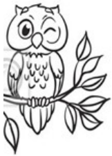
Cukiernia Sowa ???