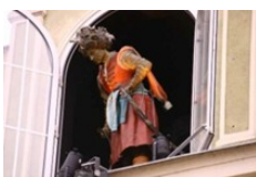
Mistrz Twardowski Stary Rynek 15, Bydgoszcz