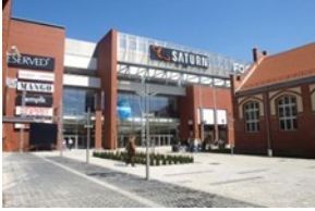
Centrum Handlowe Focus