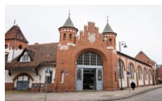
Miejska Hala Targowa (ul. Podwale 4)