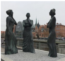
pomnik Trzy Gracje (ul. Stary Port)