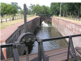
śluza na Kanale bydgoskim