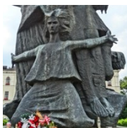
Pomnik Walki i Męczeństwa Ziemi Bydgoskiej (Stary Rynek)