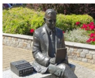
Ławeczka Mariana Rejewskiego