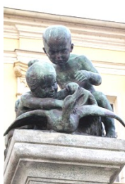
Fontanna Studzienka Stary Rynek, Bydgoszcz