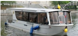
Bydgoski Tramwaj Wodny „Słonecznik”