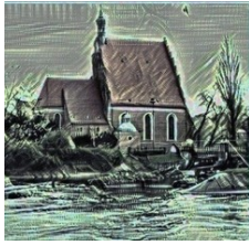
Parafia katedralna św. Marcina i Mikołaja w Bydgoszczy