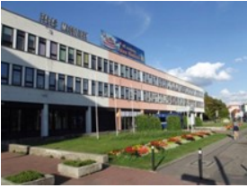
Pałac Młodzieży w Bydgoszcz