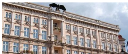
Hotel Pod Orłem