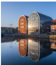
Siedziba mBanku w Bydgoszczy ul. Grodzka 19-21