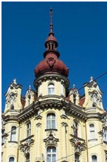
Kamienica Plac Wolności 1 w Bydgoszczy