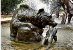
Fontanna Potop ( Park im. Kazimierza Wielkiego )