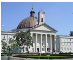
Bazylika mniejsza św. Wincentego a Paulo