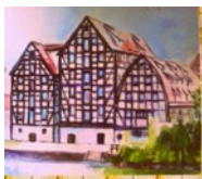
Spichrze ul. Grodzka