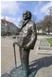
Pomnik Szwalbego ul. Andrzeja Szwalbego